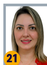
21 PALOMA DO RH 1064 VOTOS