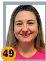
49 CRIS DO RH 647 VOTOS