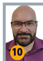
10 DOJÚ 966 VOTOS