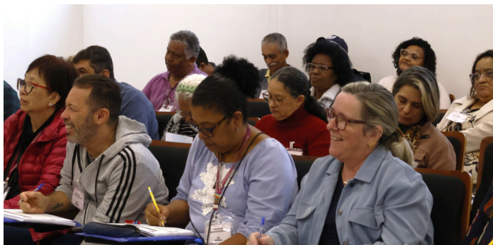
Programa de Preparação para Aposentadoria- Encontro "Projetos Pós- carreira".

Encerrando o ano, os três programas reafirmaram que a previdência é também expressão de direito e cidadania, ao garantir ao segurado acesso a informação, orientação e participação . Assim, o IPRESB segue comprometido em acompanhar cada etapa da trajetória do servidor com responsabilidade, presença e humanidade.