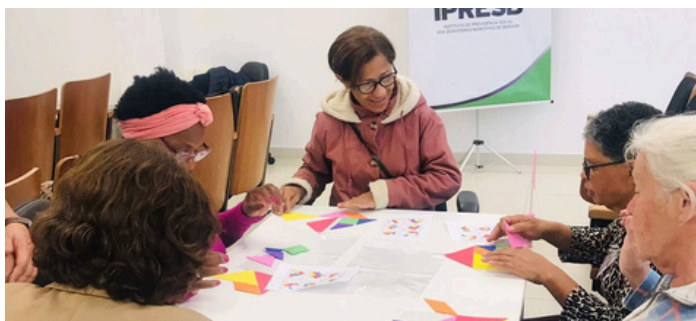
Programa Pós- Aposentadoria- Visita à "Horta da Gente" e "oficina de Jogos de Lógica".